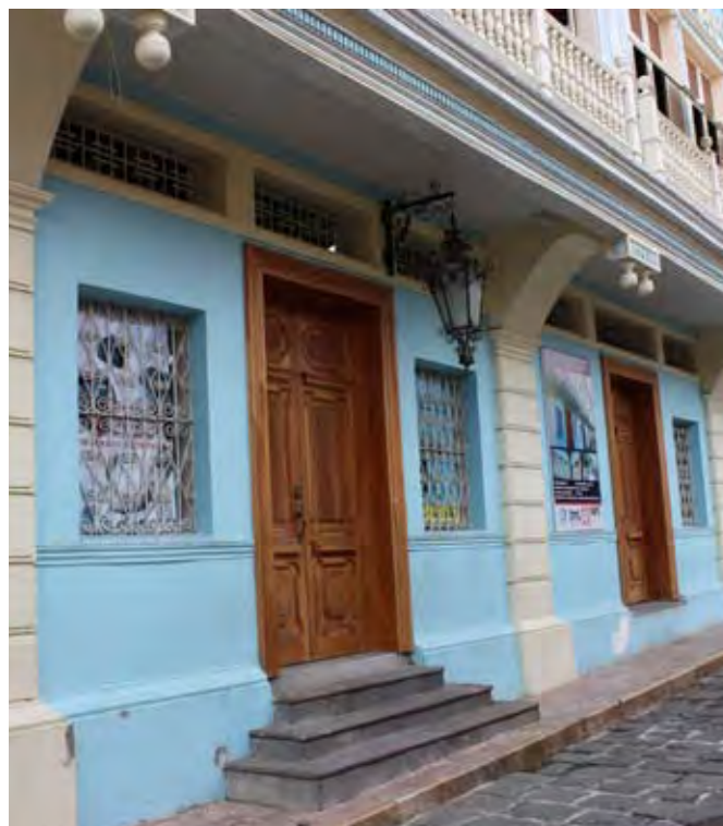
Casa Eva Calderón, actual sede del INPC, Guayaquil

En Guayas se registraron 539 inmuebles arquitectónicos con valor patrimonial. La ciudad de Guayaquil es la que conserva, en mayor