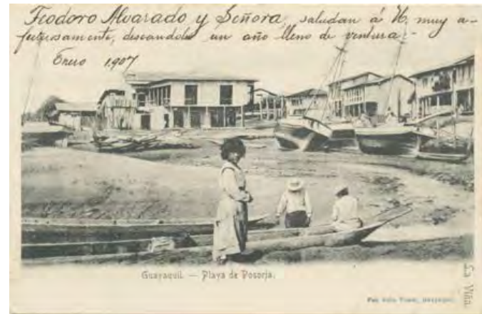
Vista paisaje, playa de Posorja Fotógrafo Julio Timm/Enero 1907

Entre los contenedores más importantes están: el Archivo Histórico del Guayas, con un fondo bibliográfico de 59.241 volúmenes; cerca de 6.000 documentos fotográficos; un fondo cartográfico de más de 300 mapas y 15.000 manuscritos que muestran la historia del Puerto Principal desde la colonia. En este archivo, el documento más antiguo que se reporta data de 1557.