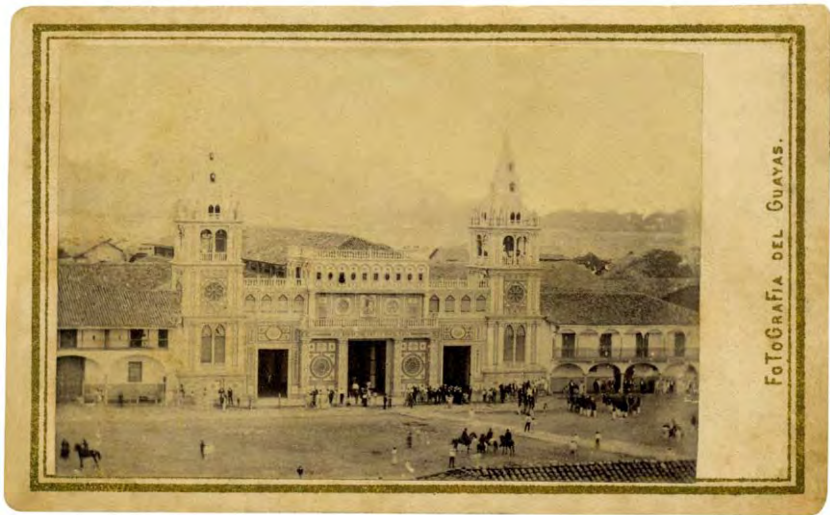
La Catedral de Guayaquil Foto de Eugene Manoury, Ca. 1862 Tarjeta de Visita en albúmina 6 x10 cm Biblioteca Aurelio Espinosa Pólit, Quito