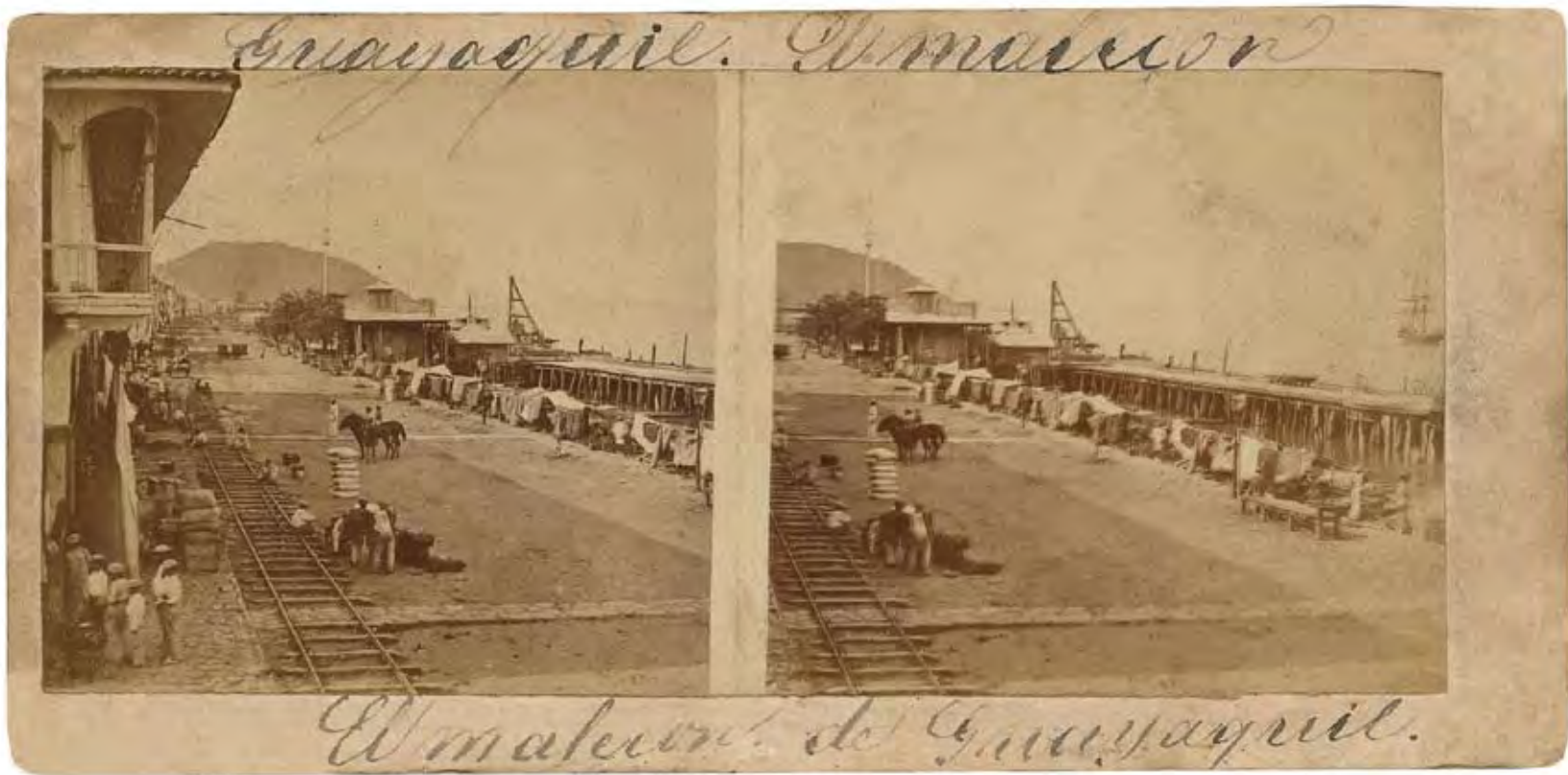
El Malecón, Guayaquil Fotógrafo no identificado, Ca. 1870 Esteoscópica en albúmina 7 x 7.3 cm (cada una) en soporte de 8.4 x 17 cm