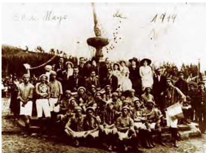
Equipo de futbolistas, 28 de mayo de 1919

En la provincia de Bolívar se han registrado 114 contenedores, de los cuales 90 corresponden a archivos públicos, eclesiásticos y privados y 24 a bibliotecas con fondos bibliográficos antiguos.