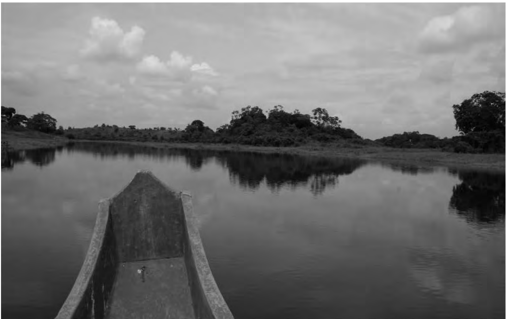
FIGURA 4. EL HUMEDAL ABRAS DE MANTEQUILLA EN INVIERNO, VISTA DESDE EL RECINTO EL RECUERDO, ÉPOCA EN QUE LA GENTE PREFERE TRANSPORTARSE POR CANOA. EL RECORRIDO ES MÁS CORTO QUE POR LA CARRETERA.