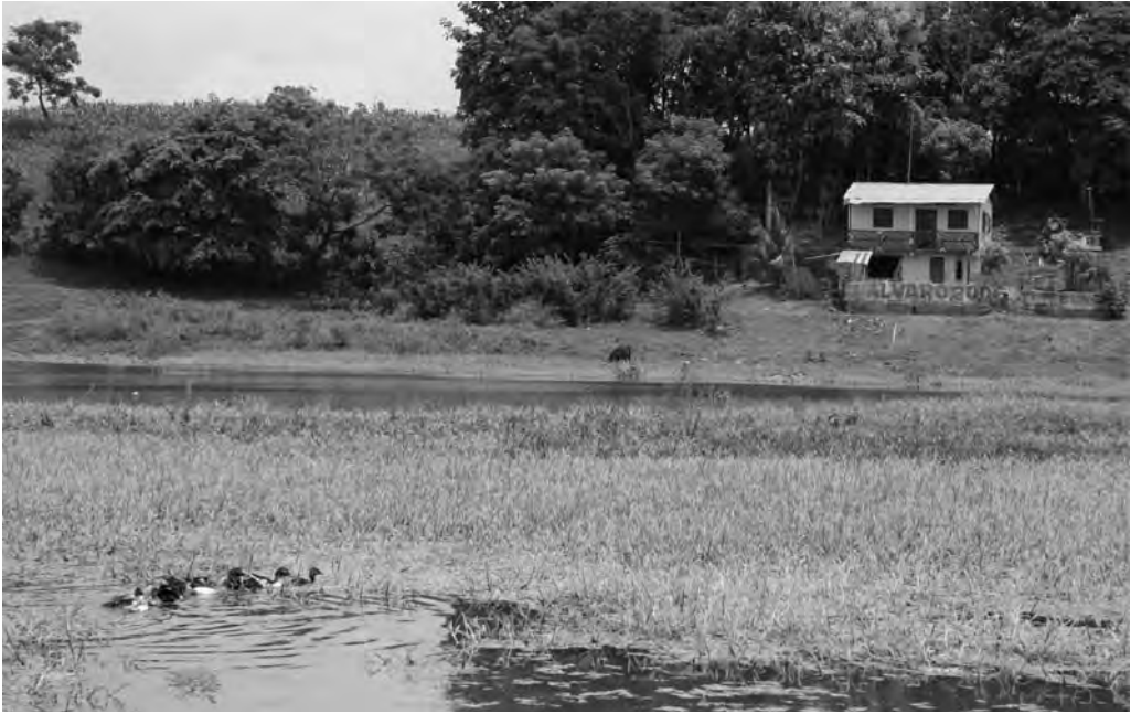
FIGURA 3. EL HUMEDAL ABRAS DE MANTEQUILLA EN VERANO, VISTA DESDE EL RECINTO EL RECUERDO, CON APENAS UN ESPEJO DE AGUA. EN ESTA ÉPOCA SE APROVECHA LAS TIERRAS INUNDABLES PARA SEMBRAR ARROZ VERANIEGO.