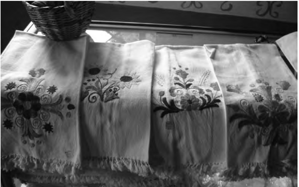
FIGURA 2. BORDADOS ELABORADOS A MANO POR LAS MUJERES DE LA COMUNIDAD SAN CLEMENTE, EXPUESTOS EN LA TIENDA COMUNITARIA.