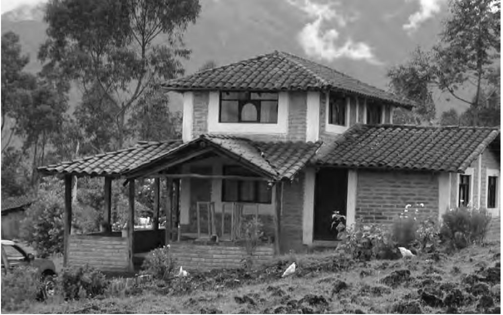
FIGURA 1. CABAÑA CONSTRUIDA EN LA COMUNIDAD DE SAN CLEMENTE PARA RECIBIR TURISTAS EXTRANJEROS.