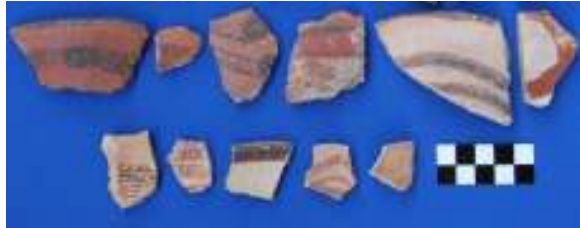
Foto 5: Los fragmentos de Intermedio Tardío y Horizonte Tardío