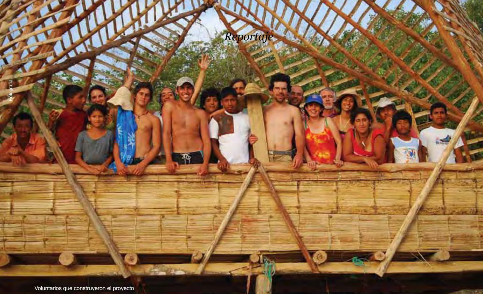
Voluntarios que construyeron el proyecto