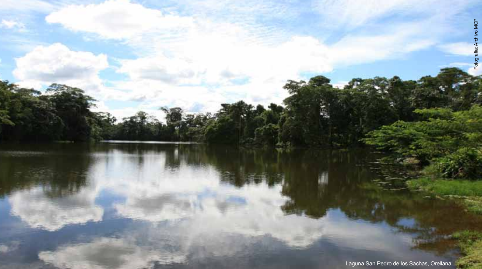
Laguna San Pedro de los Sachas, Orellana

miembros de los gobiernos parroquiales respecto de su participación activa en la identificación, protección, conservación, puesta en valor y uso social del patrimonio cultural, para lo cual se revisan los conceptos de cultura, bienes culturales, patrimonio cultural, valor del patrimonio, clasificación y soporte legal para la protección del patrimonio.