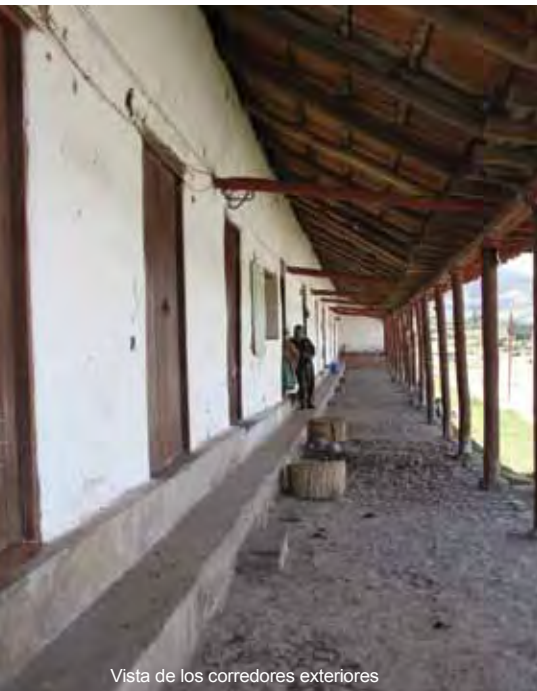
Vista de los corredores exteriores

La restauración ha considerado entre otros aspectos la colocación de baldosa, piedra, gres y bordillos en patios y corredores; porcelanato en el hall-galería, cafetería, restaurante, cuarto de máquinas, bodegas y cocina; cerámica en las baterías sanitarias;