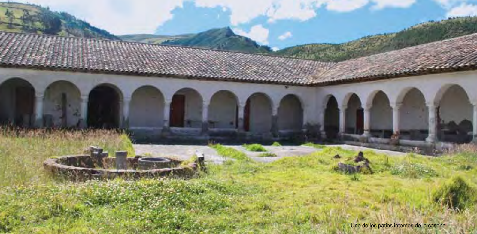
Uno de los patios internos de la casona

y madera en las áreas sociales, de alojamiento y exhibición de la hostería.