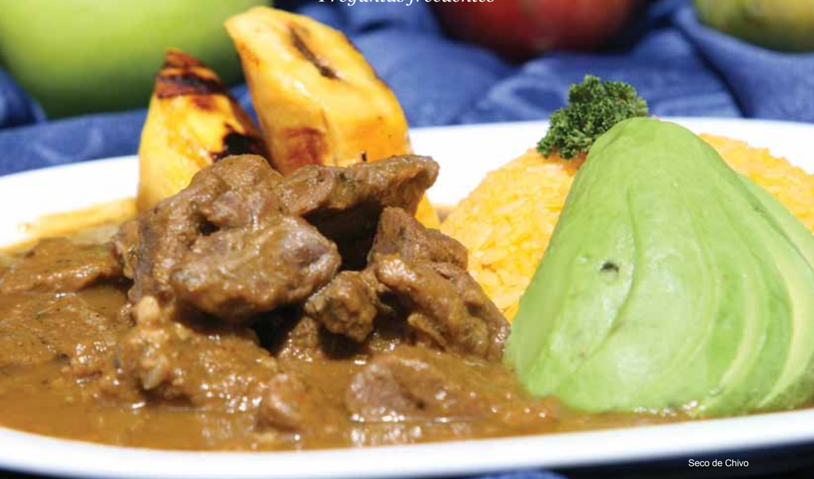
Seco de Chivo