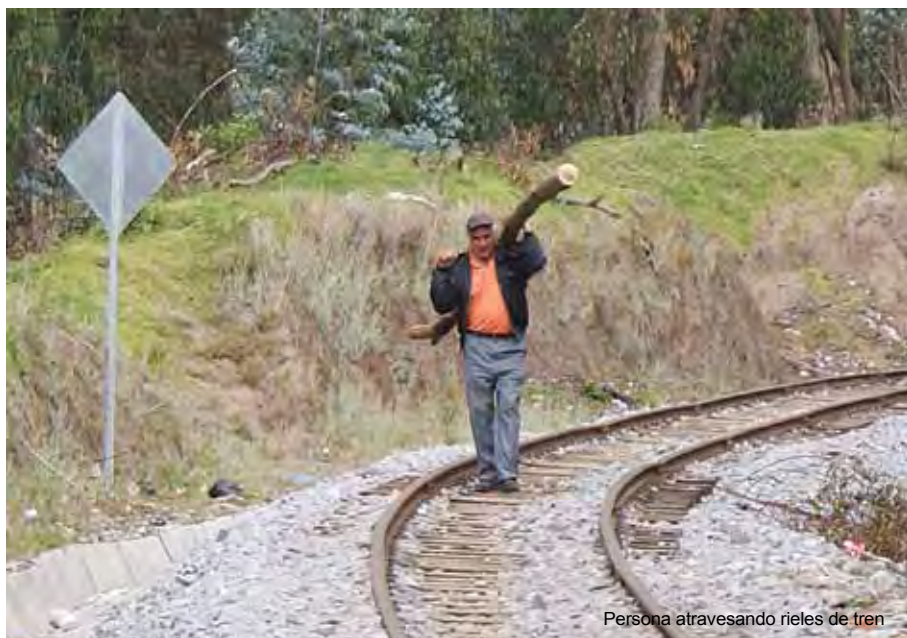
Persona atravesando rieles de tren

e l tren patrimonial del Ecuador ahora tiene un uso turístico. Todos podemos ser guardianes de este patrimonio, pasando la voz a familiares y amigos con consejos prácticos para estar a salvo en la vía férrea. Los trenes se mueven rápido, tardan en detenerse y están más cerca de lo que se cree. Por eso Ferrocarriles del Ecuador recomienda a la ciudadanía tener estos cuidados: