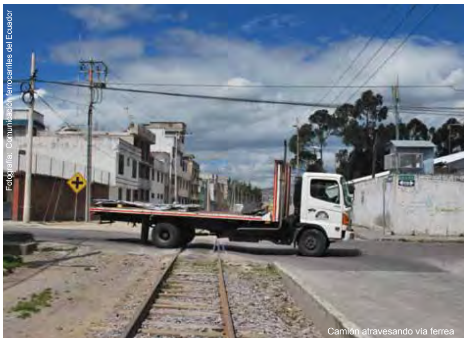
Camión atravesando vía férrea