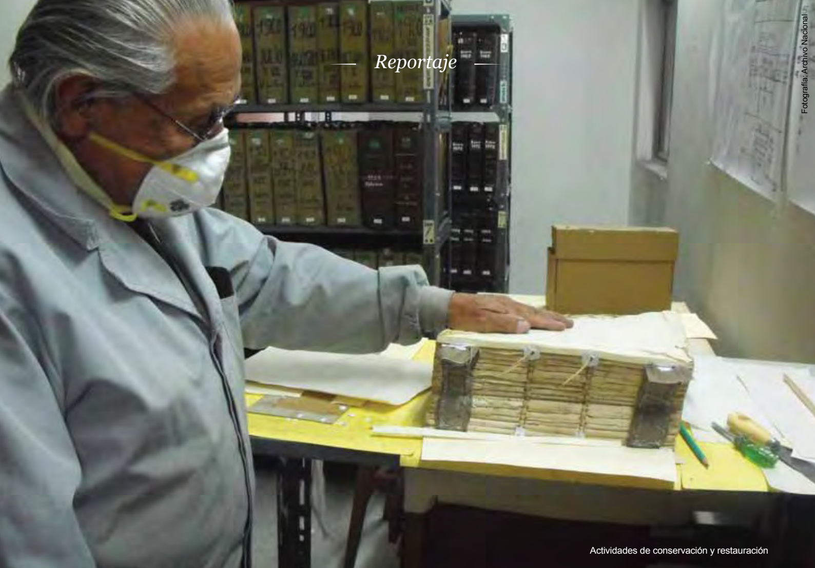
Actividades de conservación y restauración