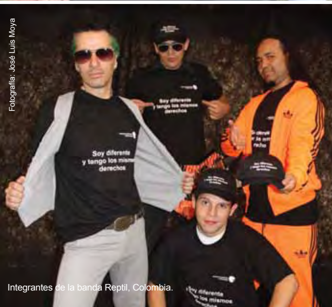
Integrantes de la banda Reptil, Colombia.