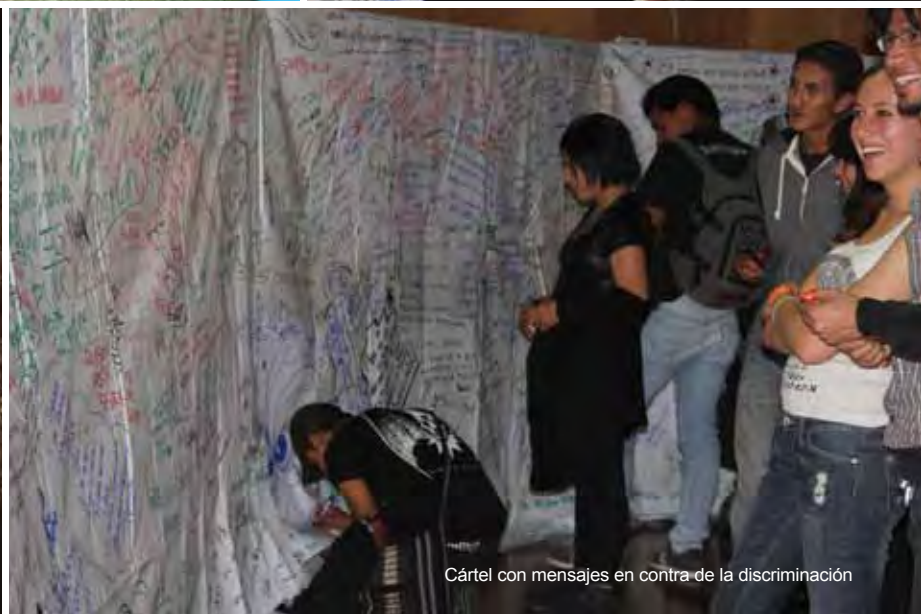
Cártel con mensajes en contra de la discriminación