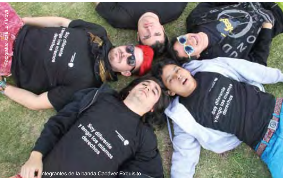
Integrantes de la banda Cadáver Exquisito

En las próximas semanas el Ministerio Coordinador de Patrimonio continuará trabajando en estos espacios públicos de la mano de los roqueros y roqueras, para sumar más compromisos de los y las jóvenes para lograr un Ecuador incluyente y libre de todas las formas de discriminación.