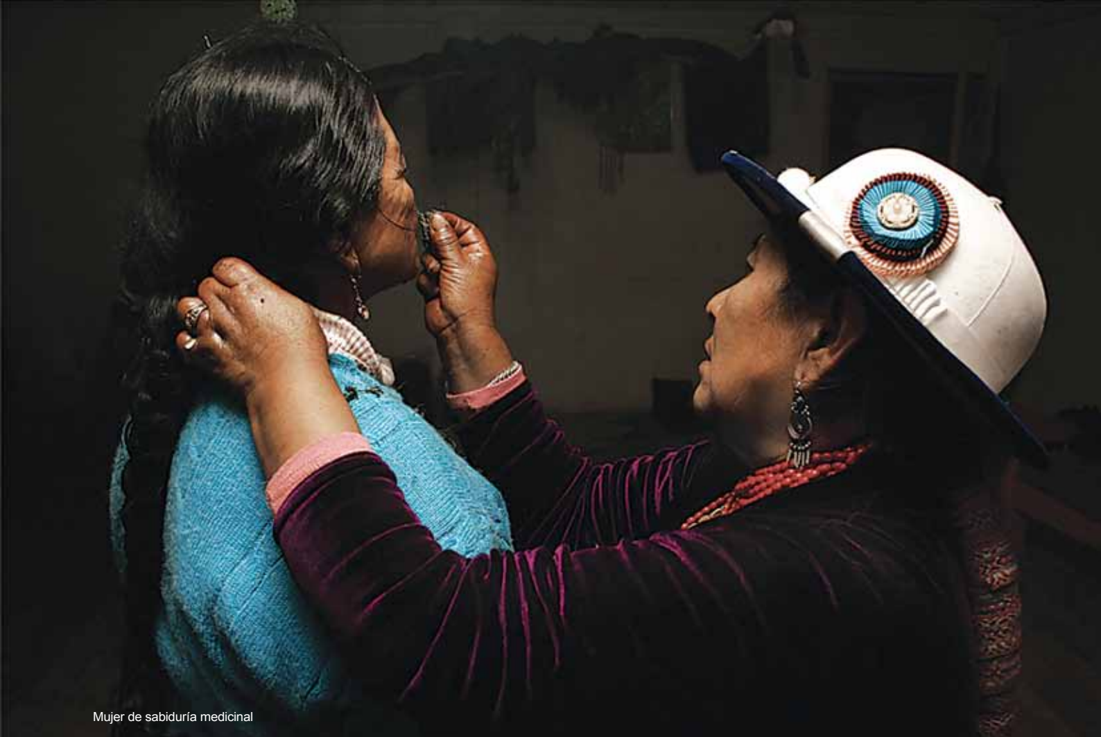
Mujer de sabiduría medicinal