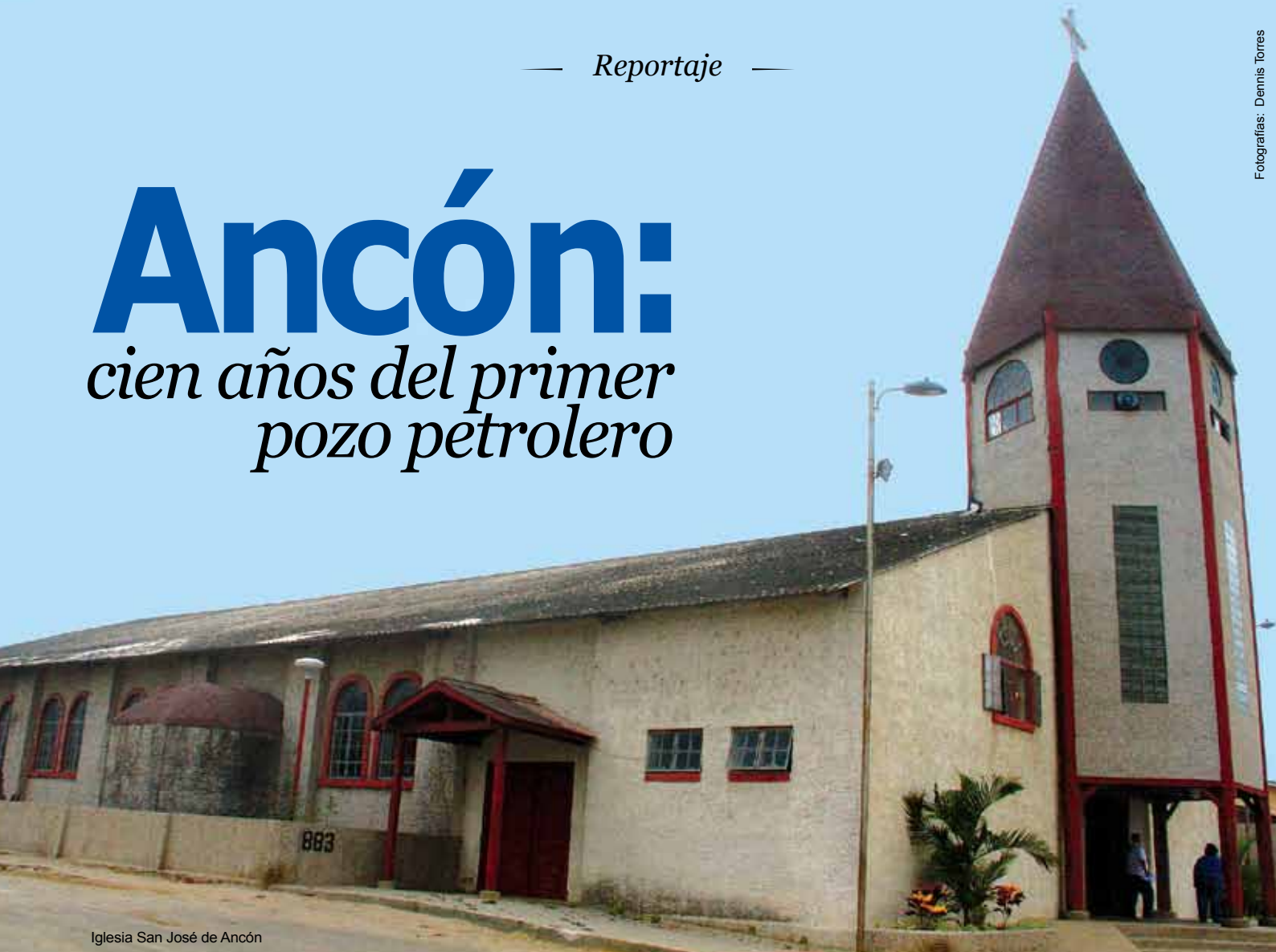
Iglesia San José de Ancón

e l 5 de noviembre de aquel 1911 fue un día muy especial. Todos esperaban ansiosos e impacientes. En Santa Elena y, sobre todo, en una pequeña población, denominada Ancón, se vivía un momento muy particular. Los técnicos ingleses, en una pequeña hondonada, habían instalado el primer pozo y días atrás habían empezado a perforarlo. Muchos pobladores se arremolinaron en su alrededor. El sacerdote de Santa Elena había acudido a bendecir el pozo. Todos esperaban expectantes, hasta que, cuando llegaron a los 2 111 pies de profundidad, el pozo “sopló” y todos estallaron en gritos y “vivas”. Se abría una nueva era para Ecuador. Nadie