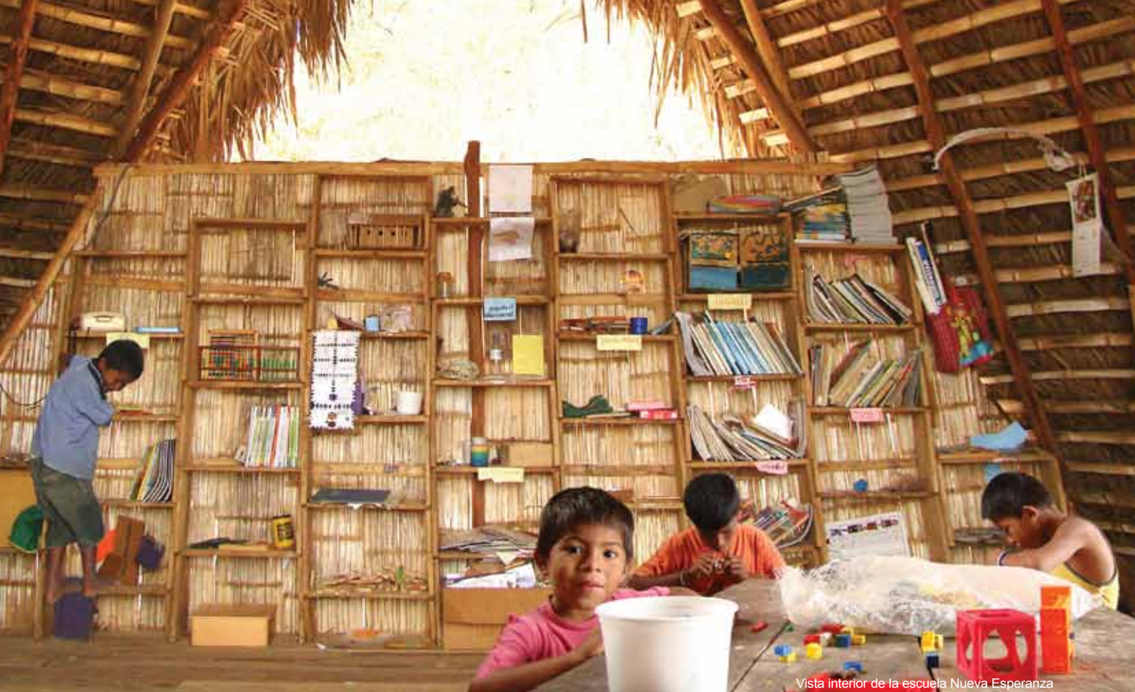
Vista interior de la escuela Nueva Esperanza

lo que emprendimos la construcción de un nuevo local". El Profesor