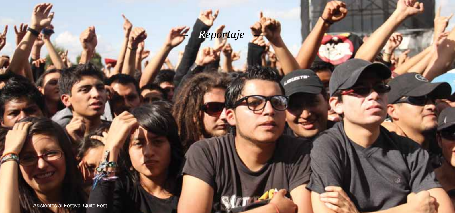
Asistentes al Festival Quito Fest