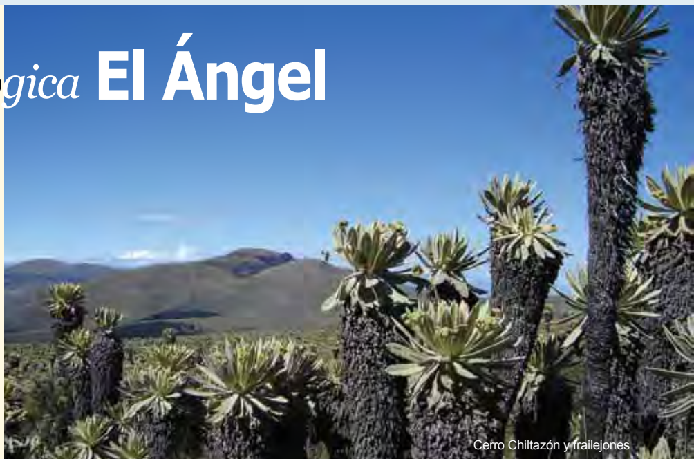
Cerro Chiltazón y frailejones

La Reserva Ecológica El Ángel, ubicada en el cantón Espejo de la provincia del Carchi, posee una extraordinaria biodiversidad de páramo; es exclusiva, su principal asociación vegetal está constituida por los frailejones plantas compuestas, arbustivas, caracterizadas por sus hojas que pueden alcanzar los 7 metros. Es uno de los dos ecosistemas de páramo de frailejones endémicos protegidos en el país. Los páramos del Carchi presentan las mayores poblaciones de frailejones en el Ecuador; en la mayoría de las zonas donde se concentran núcleos de población, los suelos han sido despojados de su cobertura vegetal por efecto de una expansión de la frontera agropecuaria, lo cual es particularmente notorio en la zona de amortiguamiento de la Reserva Ecológica.