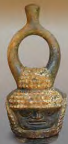
Recipiente Mayo Chinchipe