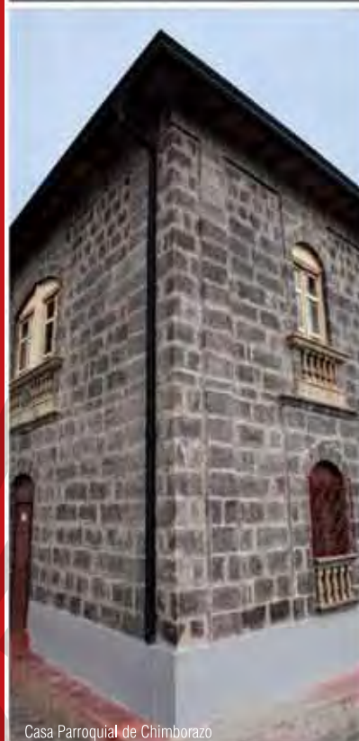
Casa Parroquial de Chimborazo